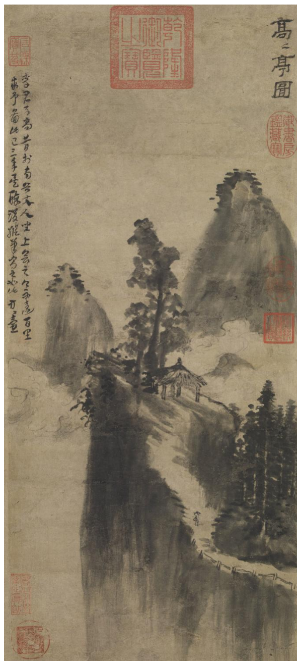
圖二 《高高亭圖》 台北故宮博物院