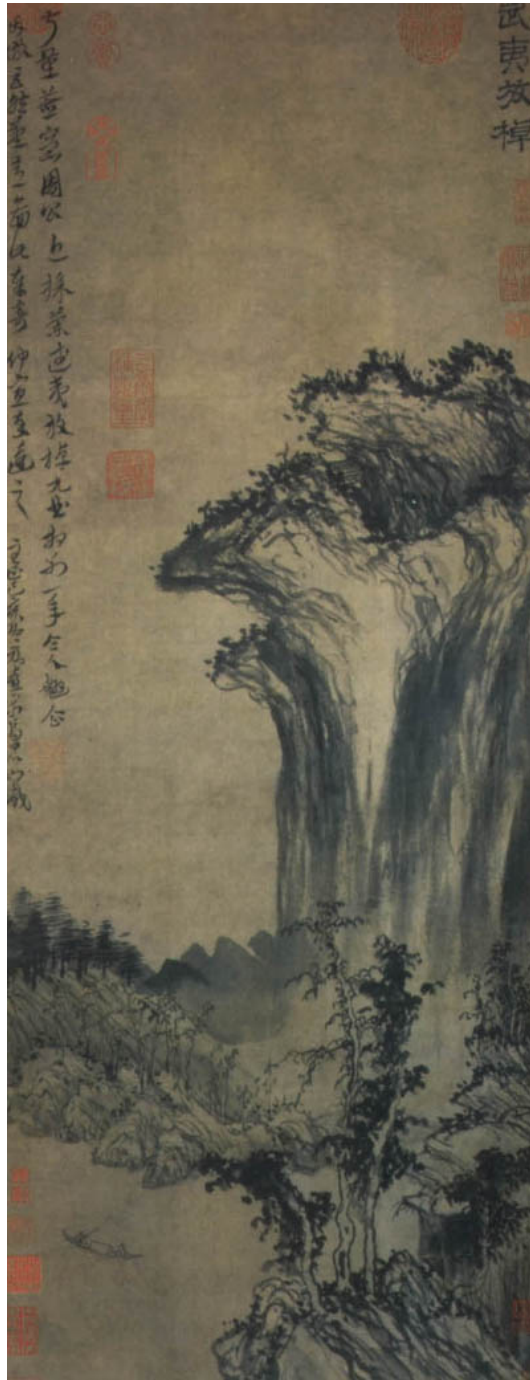
圖三《武夷放棹》北京故宮博物院