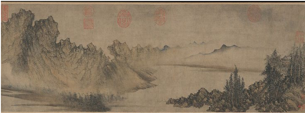
圖一《雲山圖》美國大都會美術館