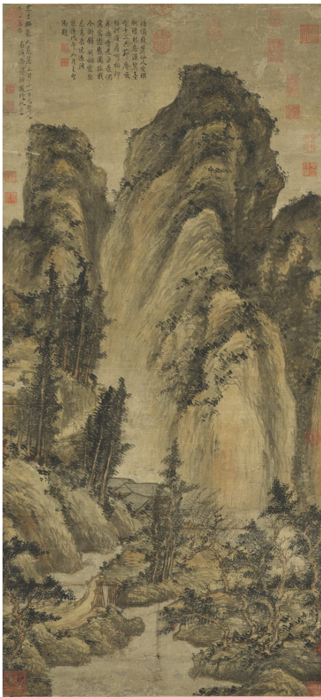
圖四《神嶽瓊林》台北故宮博物院